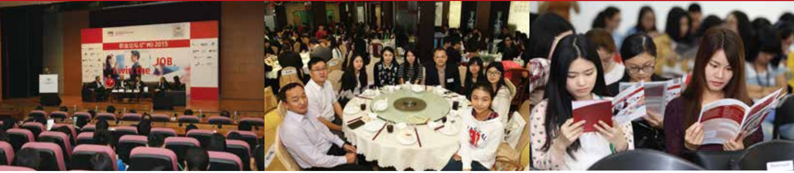
超过300名在校大学生参加职业论坛(广州)2015