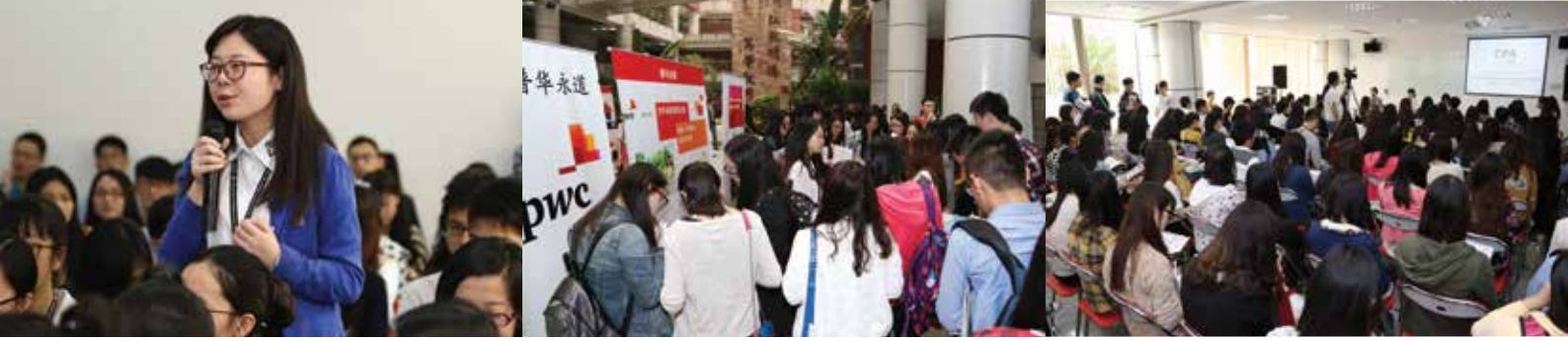
学生参加工作坊并在职业展览中与理想雇主见面