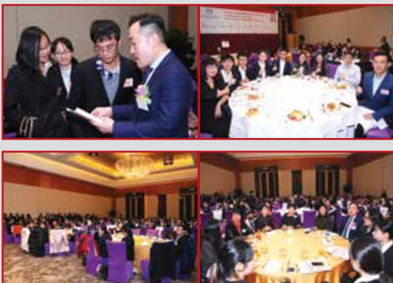
学生们都抓紧机会于午餐会上与专业会计师及商界领导者进行交流。