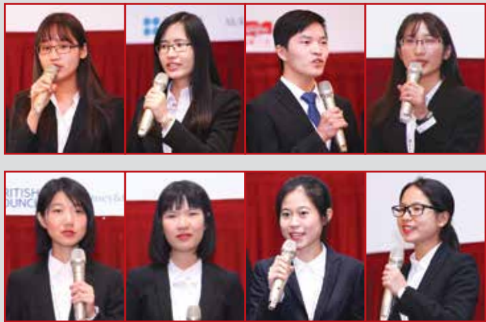
亚军及季军队伍均能在比赛中展示他们的团队合作精神和出色的演说技巧。