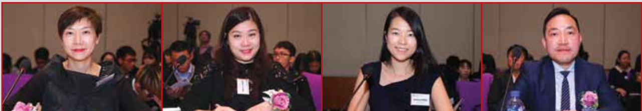
评判团一致认为各队都准备充足及表现充满信心。在问答环节中同学更能冷静分析并对答如流，叫人眼前一亮。