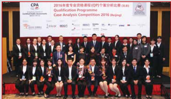
胜出队伍、优秀队伍、赞助单位及评判团合照。